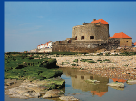
Le fort d'Ambleteuse