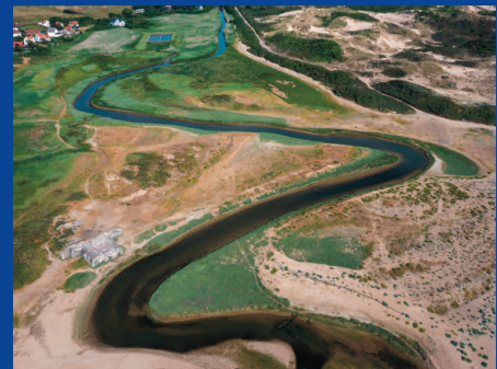
Les méandres de la Slack