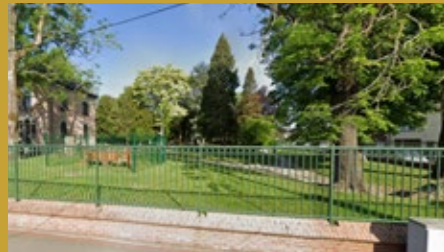
Square Pompidou