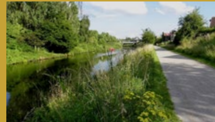
Chemin de halage