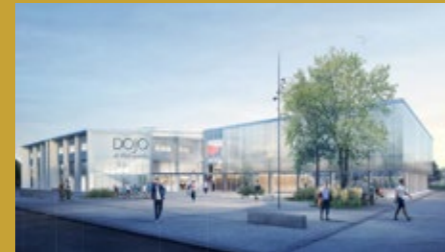
Dojo - @google