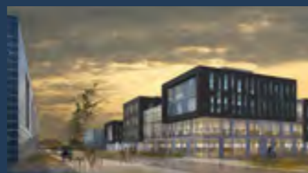
Les rives créatives