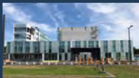
Technopole Transalley