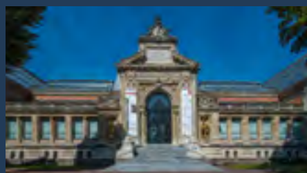
Musée des Beaux-Arts - @google