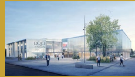
Dojo - @google