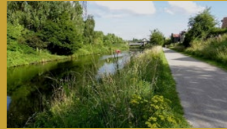
Chemin de halage