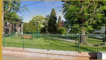
Square Pompidou