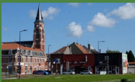
La Chapelle d'Armentières