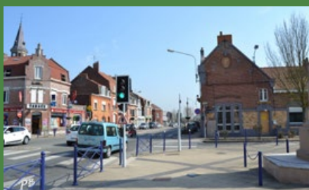
Rue nationale