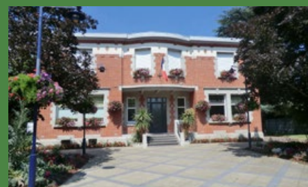
Mairie de la Chapelle d'Armentières - @wikipedia