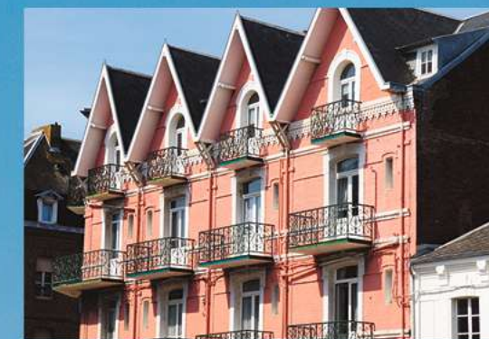
Une véritable station balnéaire