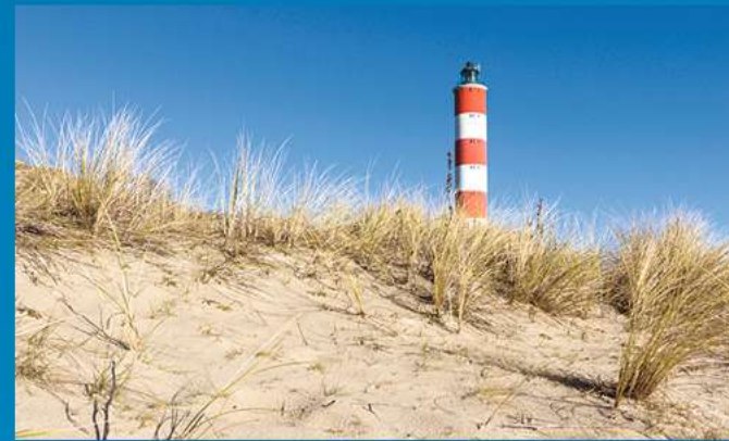
Le phare de Berck et ses 24 miles marins de portée

Promenades le long de la mer, balades dans les rues commerçantes, découvertes des phoques qui se prélassent à 50 mètres de la base nautique... Berck offre de nombreux atouts pour les familles qui veulent se sentir en vacances, à moins de 2h des grandes agglomérations des Hauts-de-France.