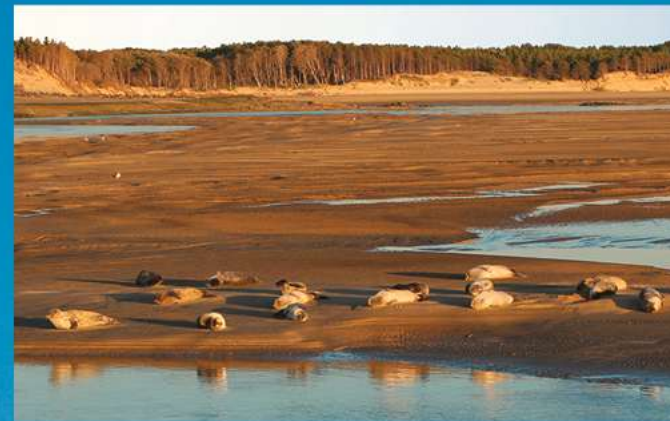
Les emblématiques phoques de la baie d'Authie