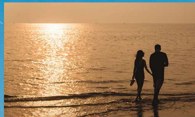
Fin de journée les pieds dans l'eau