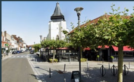
La place du Général De Gaulle - @google