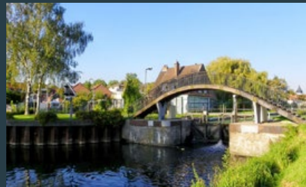
Les berges de la Marque