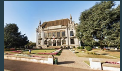
Mairie de Marcq-en-Barœul - @google