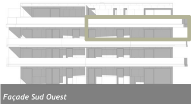
Façade Sud Ouest