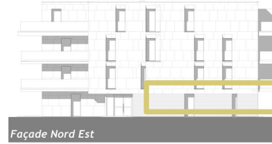
Façade Nord Est