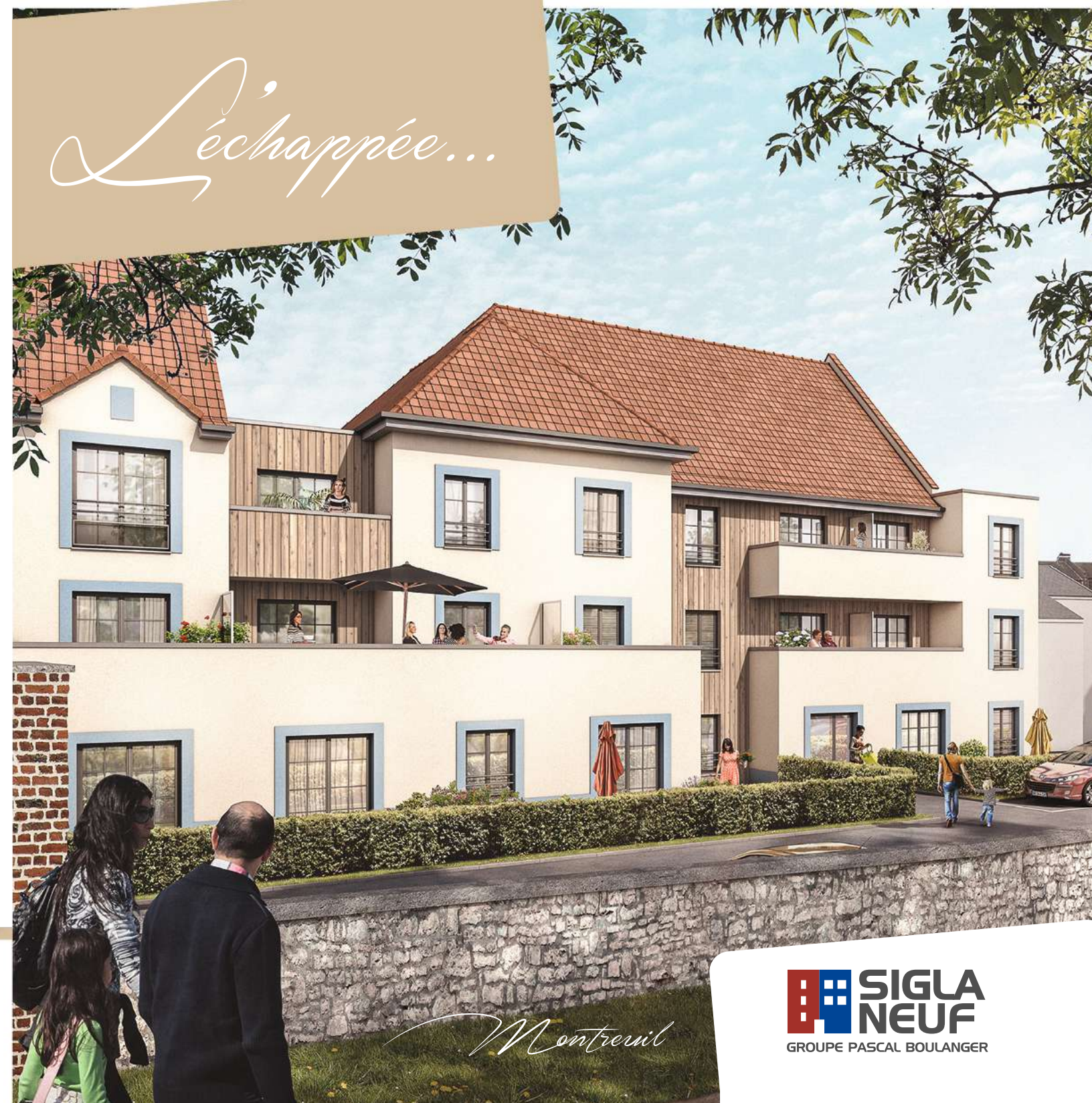
Photos et illustrations non contractuelles.