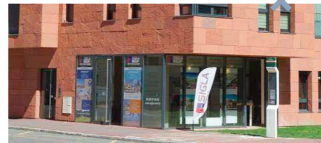
SHOW ROOM SIGLA NEUF 177 rue de Paris - Lille