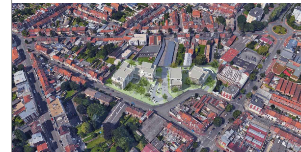
LOT A02 - BATIMENT A