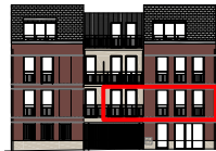
Façade Nord Ouest