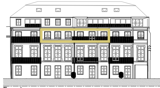
Façade sur cour