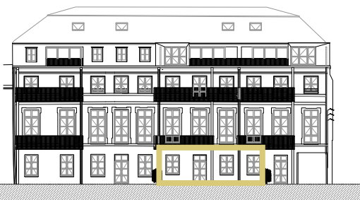
Façade sur cour