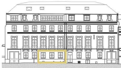
Façade sur rue