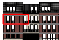
Façade Nord Ouest