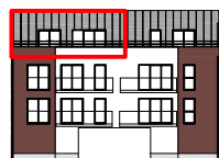
Façade Nord Ouest