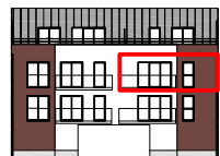
Façade Nord Ouest