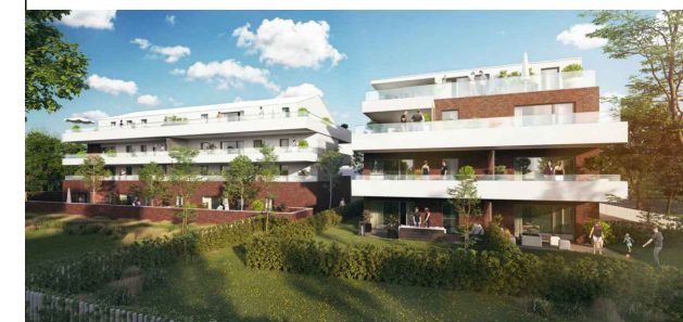
LOT 3.01 - BATIMENT 3