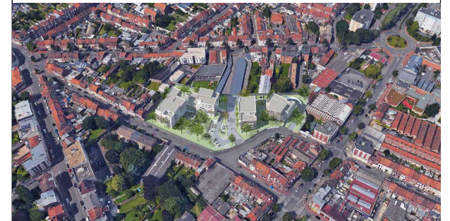
LOT A12 - BATIMENT A