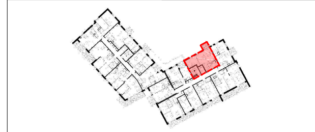
NIVEAU 02 TYPE 2