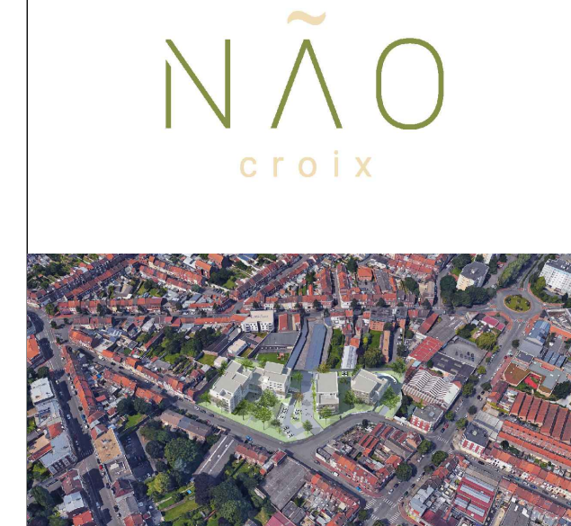
LOT A28 - BATIMENT A