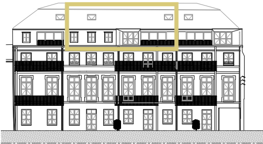
Façade sur cour