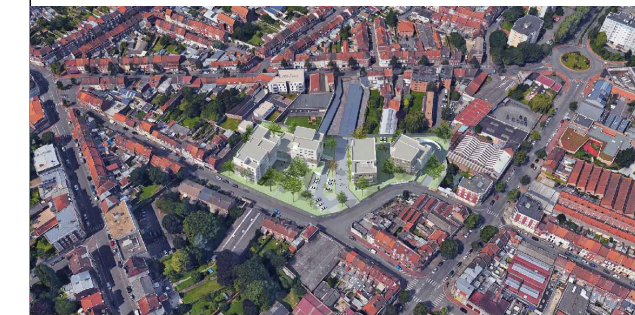
LOT A14 - BATIMENT A