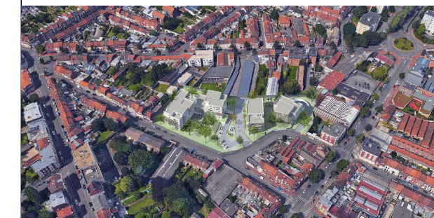
LOT B32 - BATIMENT B