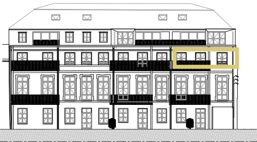
Façade sur cour