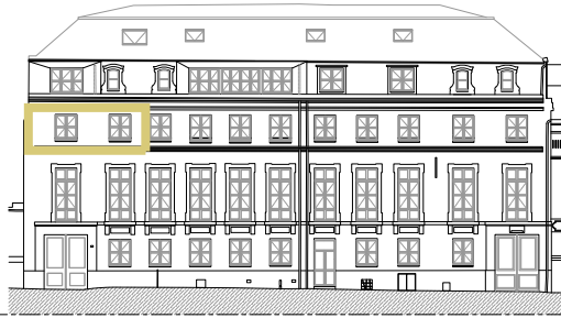
Façade sur rue