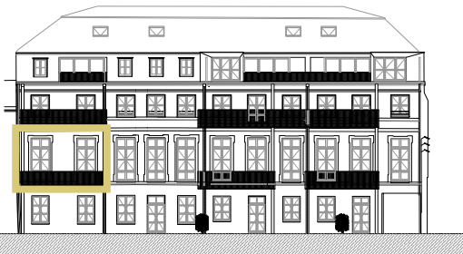
Façade sur cour