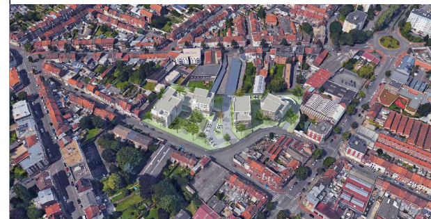
LOT A05 - BATIMENT A